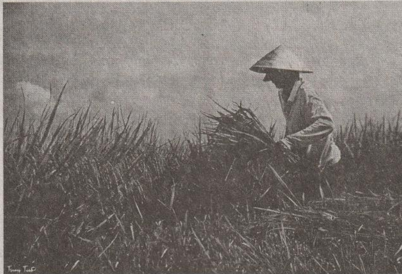
Ilustrasi petani padi di Vietnam.

Sistem pertanian cerdas 4.0 di Vietnam menandakan berakhirnya ketergantungan terhadap air, pupuk, dan pestisida. Para petani tetap membutuhkan faktor input tersebut, namun dalam jumlah yang lebih sedikit.